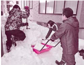
大館市社会福祉事業団