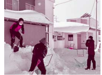
特別養護老人ホーム水交苑