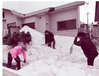
あきた北農業協同組合