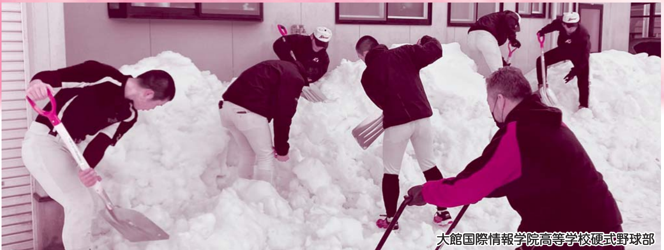
大館国際情報学院高等学校硬式野球部