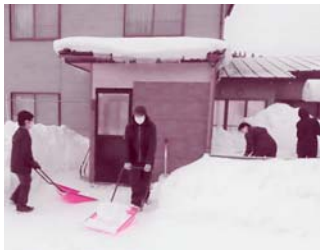
秋田職業能力開発短期大学校