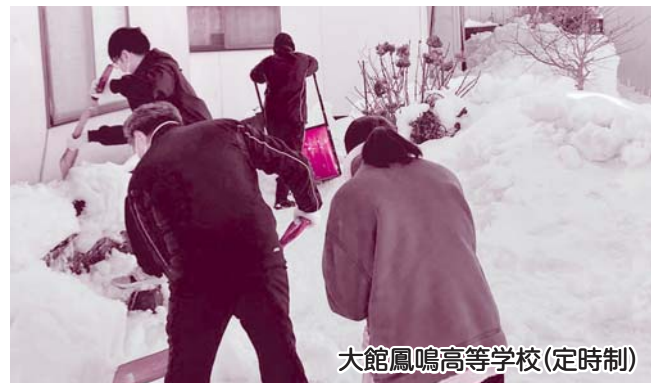
大館鳳鳴高等学校(定時制)