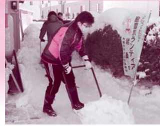
泉町地域ふくしセンター