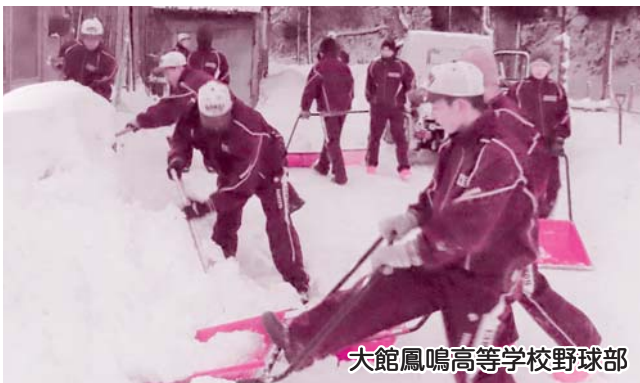
大館鳳鳴高等学校野球部