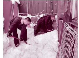
北秋田地域振興局