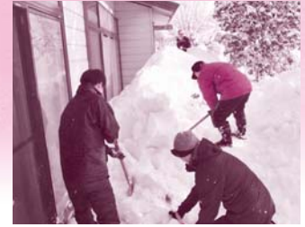
特別養護老人ホーム長慶荘