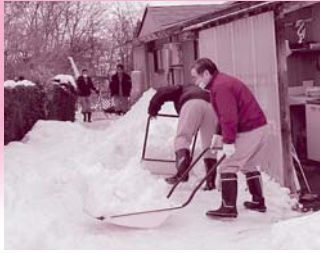
丸山建設株式会社