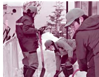
東北電力(株)秋田県北営業所・東北電力ネットワーク(株)大館電力センター