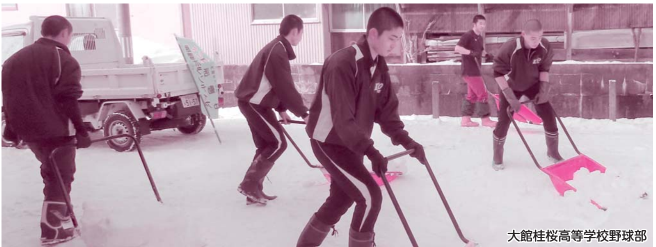
大館桂桜高等学校野球部

「大館市社協だより」は、社協会費により福祉意識啓発事業の一環として作成しております。