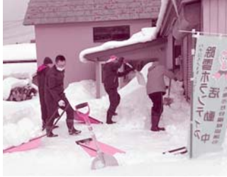
白沢通園センター