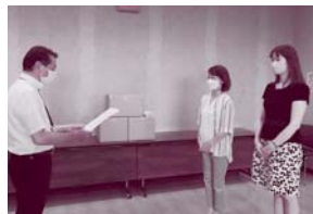
▲秋田県北部郵便局長夫人会