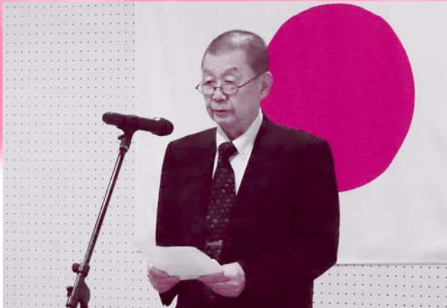
大館市社会福祉協議会 宮原会長あいさつ